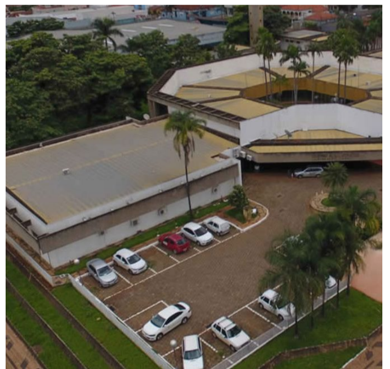
A prefeitura de Jataí alcançou nota máxima em Capacidade de pagamento em classificação do Tesouro Nacional — Foto: Reprodução.

A Capacidade de Pagamento tem o objetivo de analisar a situação fiscal dos municípios que querem contrair novas operações de crédito com garantia da União, antecipando receitas e, consequentemente, políticas públicas que beneficiam os cidadãos.