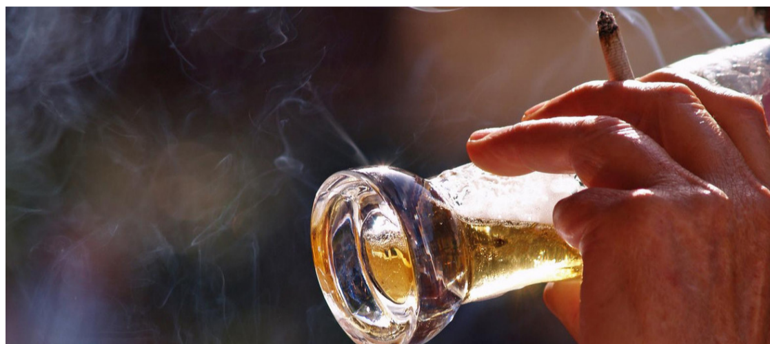
Quatro indústrias matam pelo menos 7 mil pessoas por dia na Europa, afirma diretor da OMS

“Quatro indústrias matam pelo menos 7.000 pessoas por dia em nosso continente”, explica o diretor regional da OMS para a Europa, Hans Kluge.