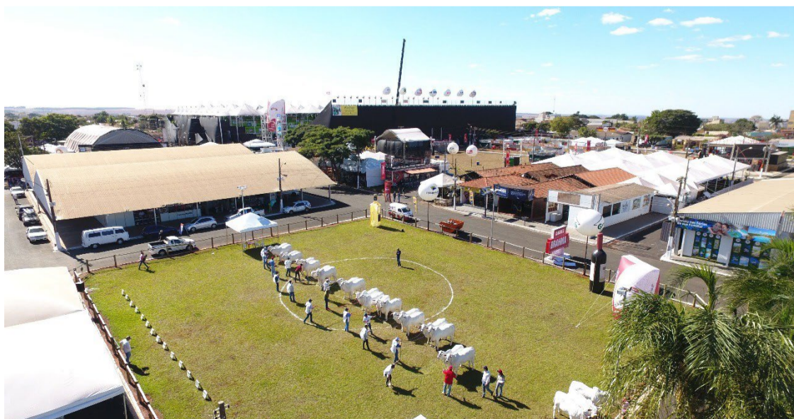
Parque de Exposições Garibaldi da Silveira Leão, recebe melhorias na estrutura para a 64ª Exposição Agropecuária de Rio Verde.

Além da fiação elétrica, o Parque de Exposições também está recebendo recapeamento das ruas, das calçadas, pintura completa.