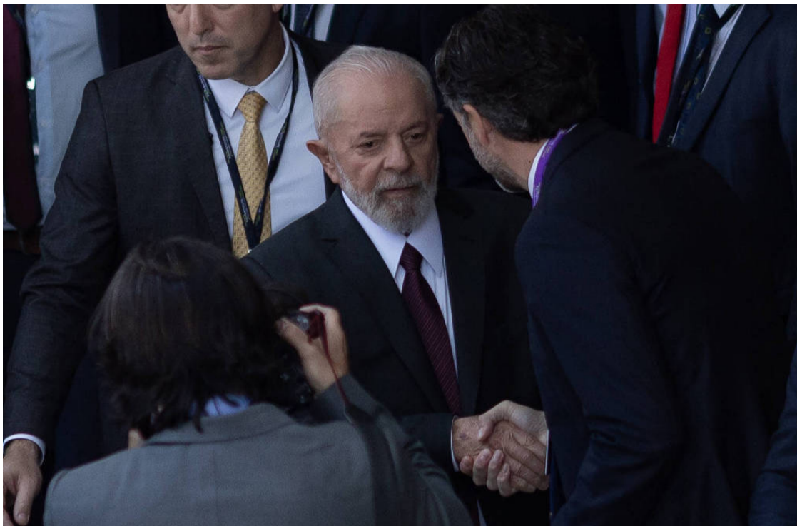
Lula da Silva: decisões de governo equivocadas desagradam presidente

Para ele, sua equipe deveria ter negociado uma fonte de receitas no momento em que firmou um acordo para manter a desoneração, ocasião em que teria mais força para fazer valer sua posição.