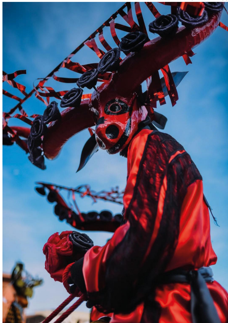
Imagem premiada para Goiás