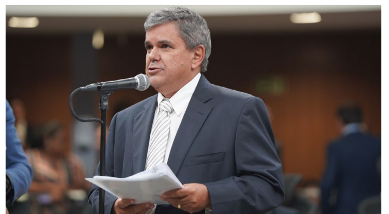
O deputado George Moraes é autor da proposição que confere ao município de Jataí o título de Capital da Agroindústria — Foto: Reprodução.

da produção agrícola, impulsionada por fatores como clima favorável, evolução constante da produção, atenção às exigências ambientais e uma sólida infraestrutura de mercado consumidor e armazenagem. A concessão do título de Capital da Agroindústria reconhece e celebra o papel fundamental de Jataí nesse cenário, consolidando sua posição como referência nacional nesse setor vital para o desenvolvimento do Brasil”, completou George Moraes ao apresentar o projeto.