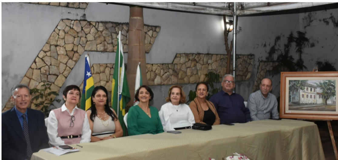
Minidicionário de Educadores: lançamento aconteceu na última terça-feira, 11 de junho

A obra tem o objetivo de resgatar a experiência dos educadores que se projetaram no cenário educacional de Rio Verde e região e contribuíram com o estudo e o encaminhamento de problemas enfrentados na área. Esse livro conta ainda com informações sobre a vida desses protagonistas e reconhece o trabalho dos profissionais da