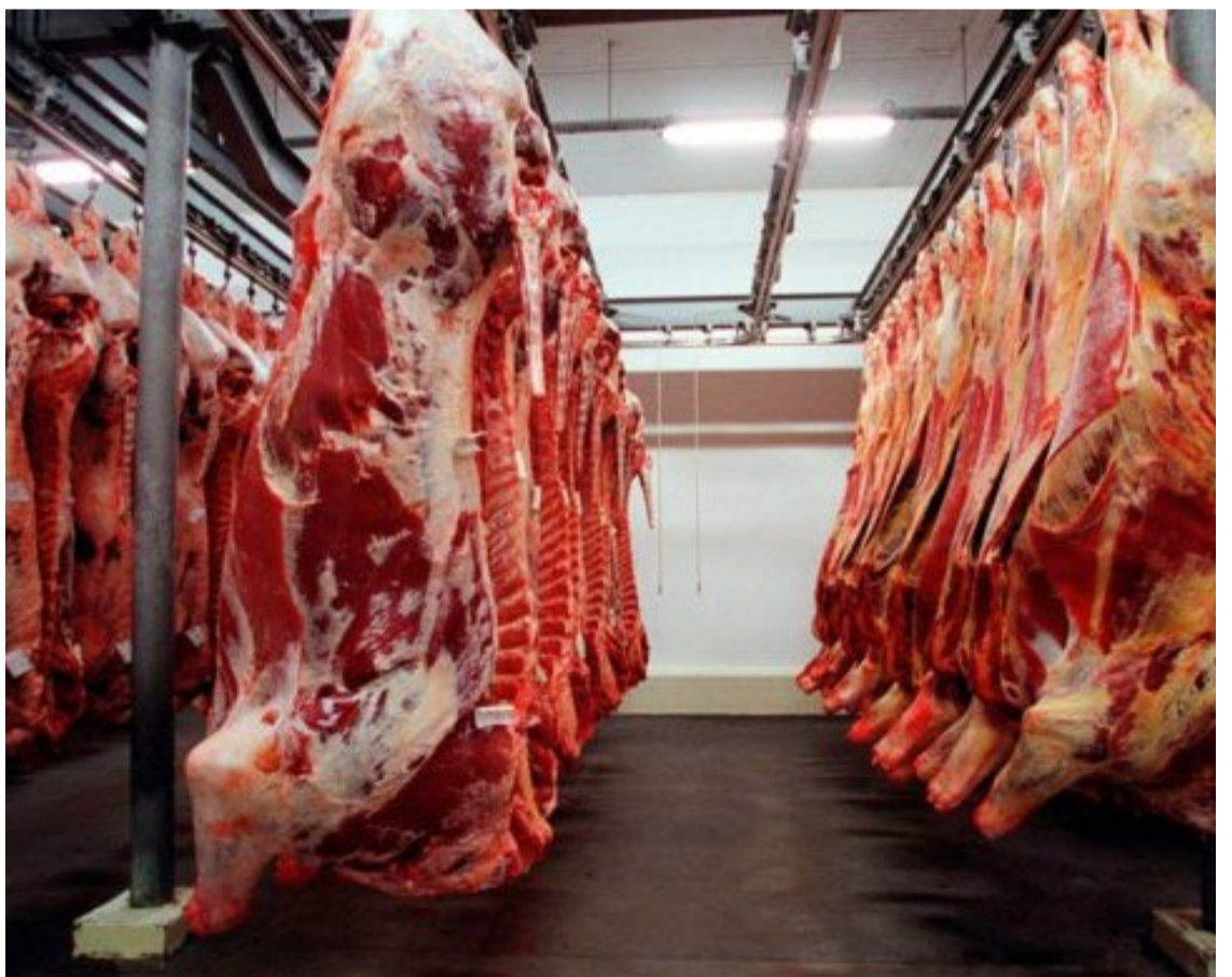
AS exportações totais de carne bovina do Brasil, incluindo produtos in natura e processados, atingiram 274.013 toneladas em maio de 2024 — Foto: Reprodução.

subiram para a terceira posição entre os maiores compradores de carne bovina brasileira desde o início de 2024. As importações saltaram de 22.786 toneladas em 2023 para 85.624 toneladas em 2024, um aumento de 275%, com a receita crescendo de US$ 101,2 milhões para US$ 393,6 milhões, um crescimento de 288%. Este