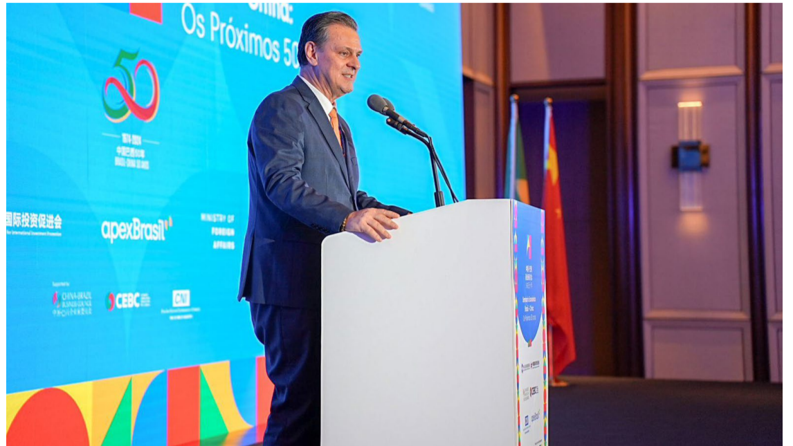
O Ministro da Agricultura, Carlos Fávaro, durante o Seminário Empresarial Brasil-China os próximos 50 anos, em Pequim

Ainda durante a missão oficial, o Governo Federal fechou acordo para a promoção do café brasileiro na maior rede de cafeterias chinesa. Por meio da parceria, a empresa se compromete a promover e comerciali-