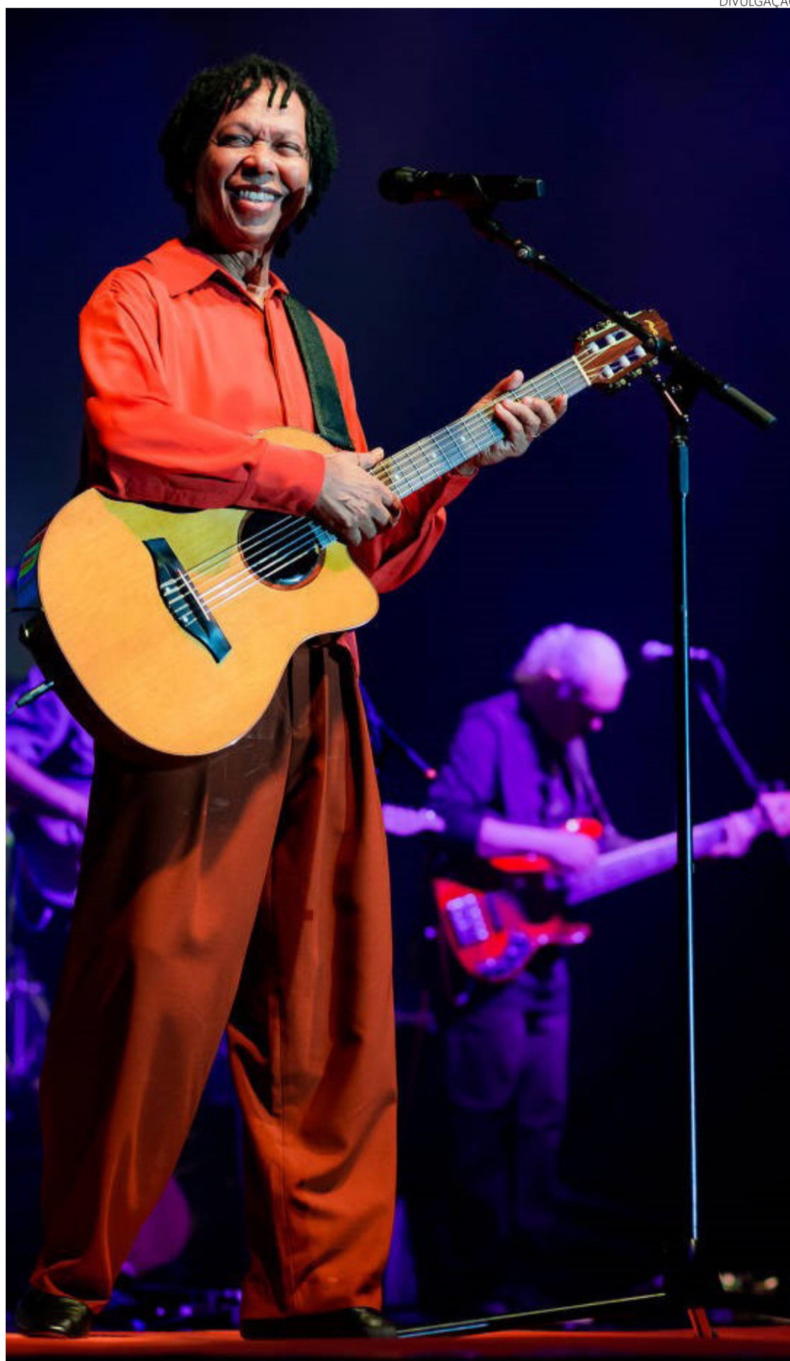
Alagoano levará ao show pelo menos 20 sucessos da carreira ao teatro da PUC

Como tantos jovens de sua geração, foi arrebatado pelo som fibrilante de Lennon, Mc-