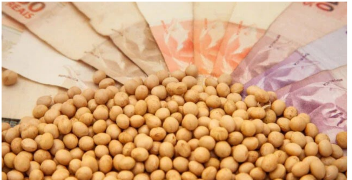
Vendas da safra 23/24 de soja chegam a 65,7%, aponta Datagro - Foto: Daniel Popov/Canal Rural.

realizado pela consultoria - a intenção de plantio sai em julho -, a projeção para safra 2023/4 é de 160,5 milhões de toneladas, o que representaria um crescimento de 9% ante a temporada atual.