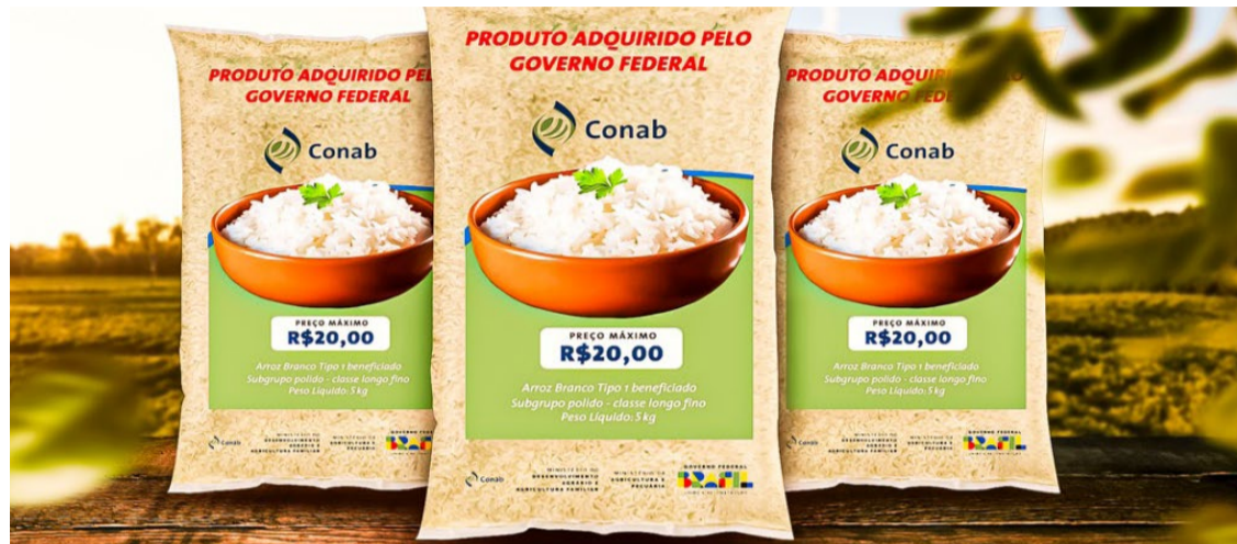
O Governo Federal divulgou rótulo do arroz importado; pacote de 5 kg deverá ser vendido por R$ 20 — Foto: Reprodução.

O leilão de importação de 263 mil toneladas de arroz foi anulado pelo governo federal nesta terça-feira (11) após indícios de incapacidade técnica